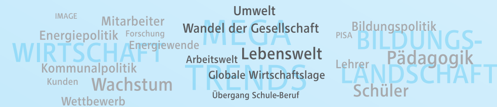
Abb. 1: Megatrends und Themenwelten unserer Bildungsinitiative.

Wen sprechen wir an und wie gestalten wir unsere Angebote? Wichtige Fragen, die zu Beginn beantwortet werden müssen – und immer wieder aufs Neue. Vor allem mit Blick auf Schulen und ihr Umfeld muss die Initiative ein klares Bild ihrer diversen Kern- und Neben-Zielgruppen erarbeiten (Abb. 2) und versuchen, diese mit adäquaten, d.h. zielgruppenorientierten Mitteln zu erreichen.